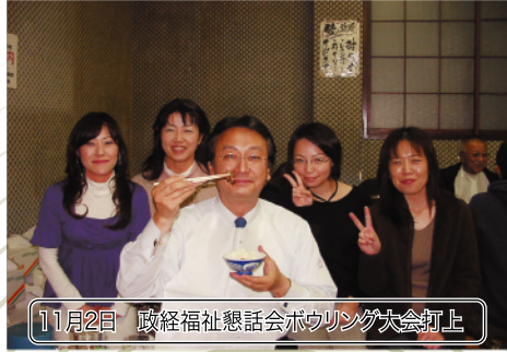
11月2日 政経福祉懇話会ボウリング大会打上