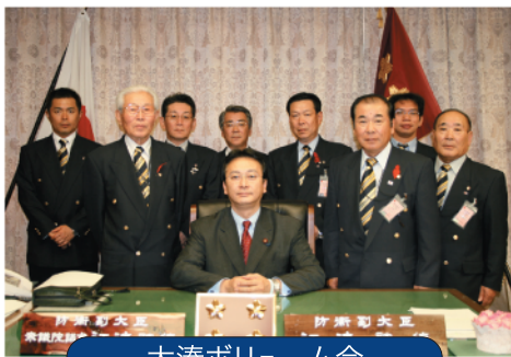
大湊ボリューム会