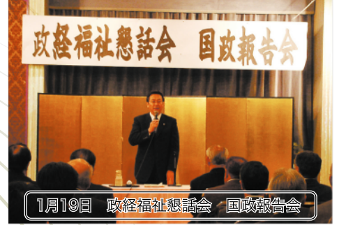
1月19日 政経福祉懇話会 国政報告会