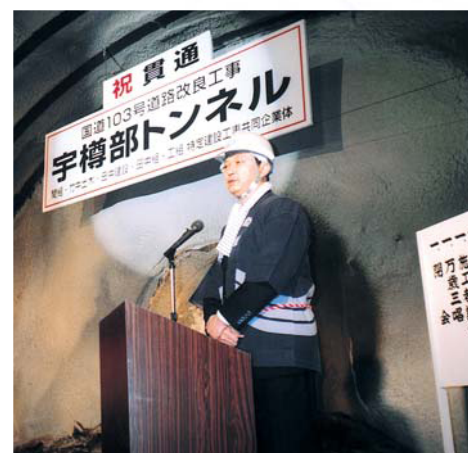
宇樽部トンネル貫通式