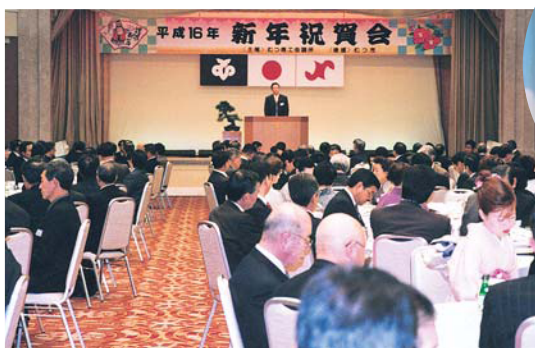
むつ地区新年祝賀会