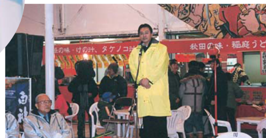
2月26日 十和田湖冬物語にて